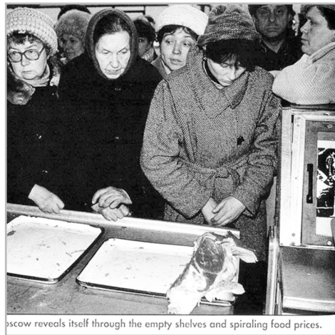
Moscow reveals itself through the empty shelves and spiraling food prices.

Мало кто знает, что пищевые советские ГОСТы, во-первых, имели примечания, в которых указывалась возможность замены одних ингредиентов на другие. Во-вторых, ГОСТы менялись часто, на некоторые виды продукции даже по два раза за сезон — в зависимости от урожая и надоев. В-третьих, продукцию для внутреннего пользования и на экспорт делали по разным ГОСТам. Так, для экспортных колбас запрещали применять какие-либо упаковочные плёнки, кроме целлофана. Разнообразный спи-